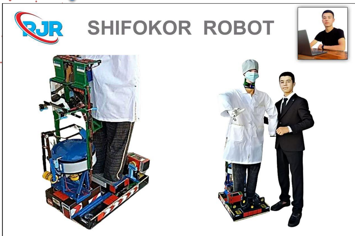
1-rasm. Shifokor robot loyihasining tayyor holati 1-versiya.