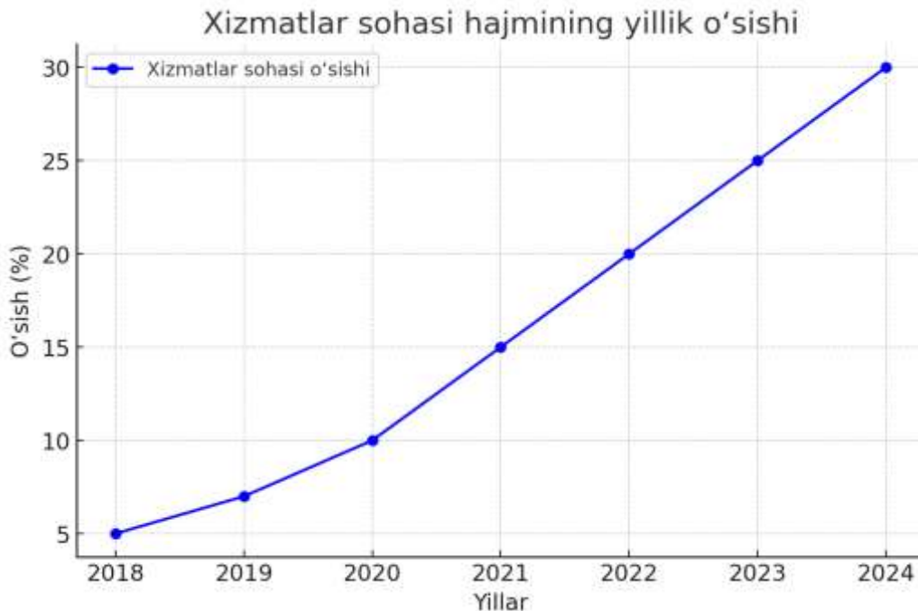
1-rasm. Xizmatlar sohasi hajmining yillik o'sish grafigi.

Bu diagramma innovatsion texnologiyalarning xizmat sifati va ish unumdorligiga ta'sirini ko'rsatadi.