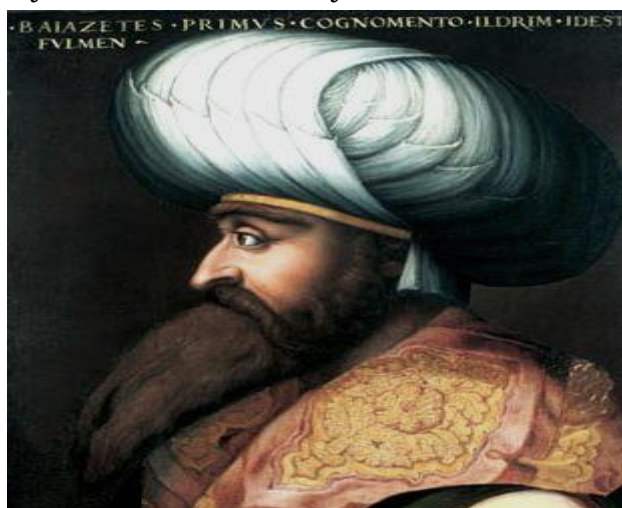
Usmoniylar hukumdori Boyazit I (1389-1402)