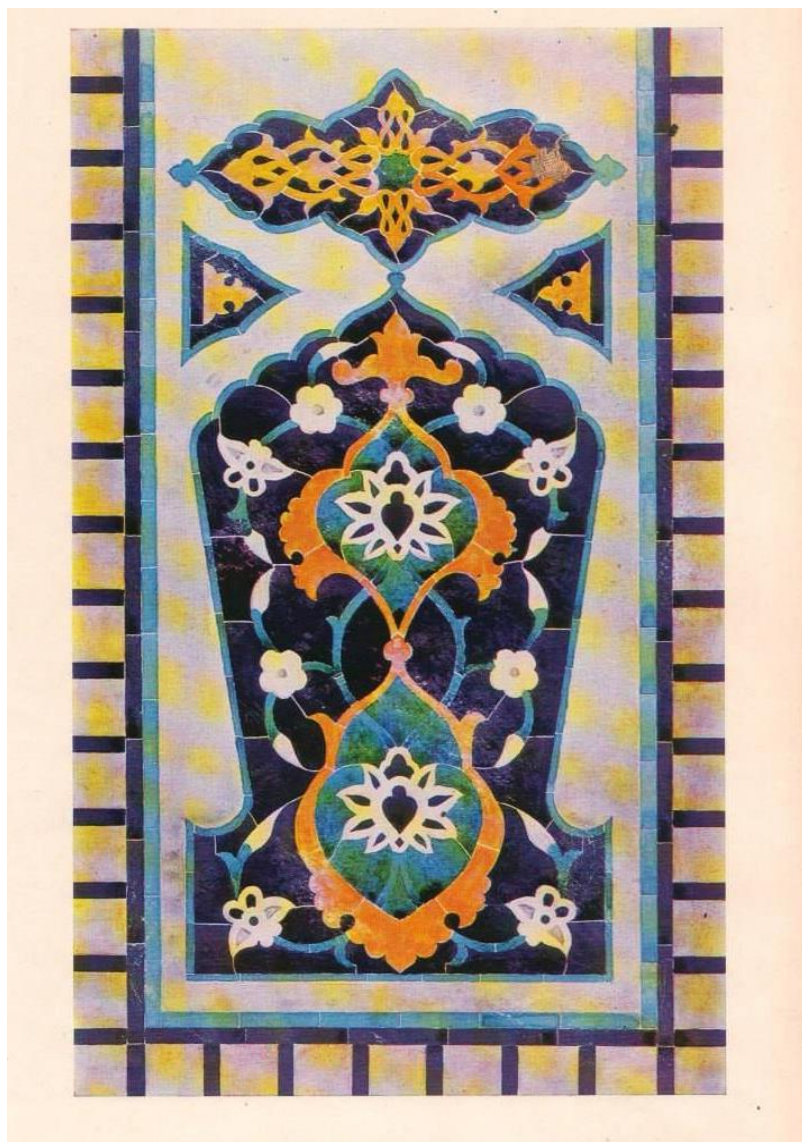
Самарқанд. Шердор мадрасаси сарой аркаси пилонидаги кошин безаги (XVII аср). М. Сағатов ишланмаси. Турсуналига 13-21 бетлар