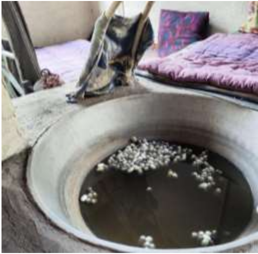
1-rasm. Pilladan tola olish.

Xulosa o`rnida aytadigan bo`lsak, O`zbekiston dunyo sivilizatsiyasi tarixi zarvaraqlarida nomi bitilgan buyuk davlatlarning vorisi. Asrlar davomida uning zaminida ajoyib badiiy asarlar, me`moriy va san`at yodgorliklari yaratilgan bo`lib, ular hozirgacha butun dunyodagi O`zbekiston xalqlari madaniyati ixlosmandlarini hayratga soladi. Mazkur merosni har taraflama va xolis o`rganish bugungi kunning dolzarb vazifasidir.