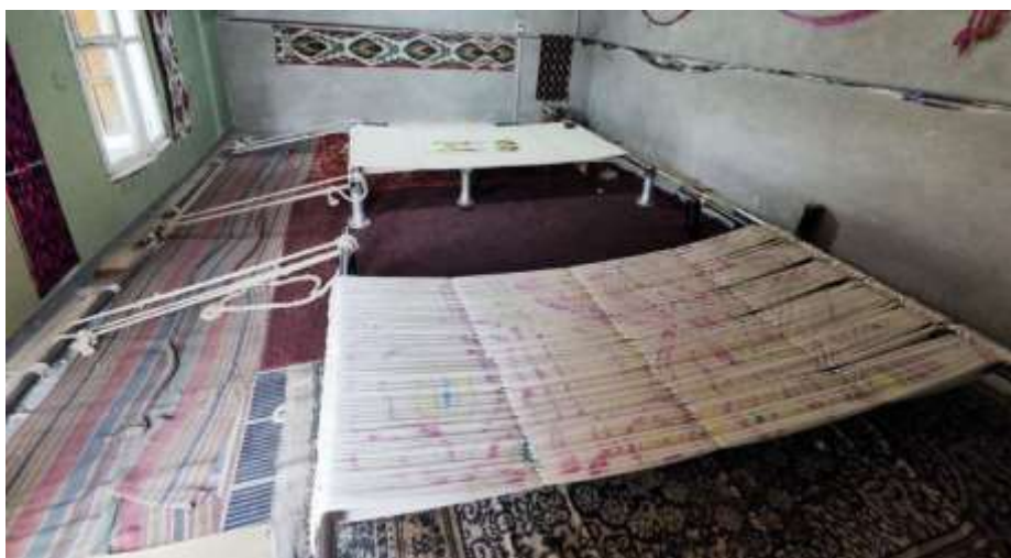
2-rasm. Qatga qatlangan, naqsh tushirilgan, livitga ajratilgan tolalar.

To'rt tepkilik matoda oldi va orqasida salgina farqi bo'lib unchalik ko'zga tashlanmaydi. Ikki tepkilik mato oldi va orqasi bir ko'rishda ajratish mumkin. Bir tomon yuza sirtqi bo'lsa tegi aksincha qoladi.