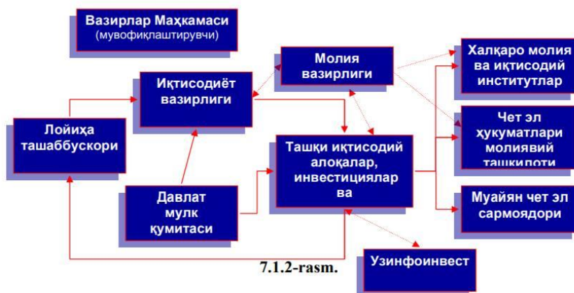
Respublikaga xorijiy investitsiya va kreditlarni jalb qilish sxemasi

Respublikamizda xorijiy investitsiya va kreditlarni jalb qilish sxemasi O'zbekiston Respublikasi Prezidentining 2008-yil 28-iyuldagi 927-sonli qaroriga muvofiq amalga oshiriladi.