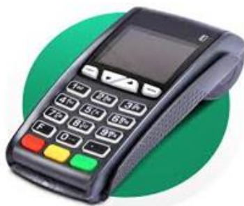
1-rasm. To'lov terminali

Elektron to'lov tizimlariga bank va bankdan tashqari to'lov terminallari, masofaviy moliyaviy xizmatlar va masofaviy bank xizmatlari (RBS), shu jumladan Internet-banking va SMS-banking, mobil bank xizmatlari, uyali aloqa operatorlarining mobil moliyaviy xizmatlari va elektron pullar kiradi.