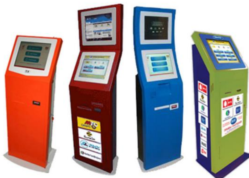
2-rasm. O'z o'ziga xizmat ko'rsatish terminallari

To'lov terminali xizmatlar uchun to'lovlarni qabul qilish mobil aloqa, kommunal xizmatlar, Internet-provayderlarning xizmatlari, bank kreditlarini to'lashda to'lovlar; to'lov tizimlaridagi shaxsiy hisobvaraqlarni, bank kartalaridagi hisobvaraqlarni to'ldirish zarur bo'ladi.