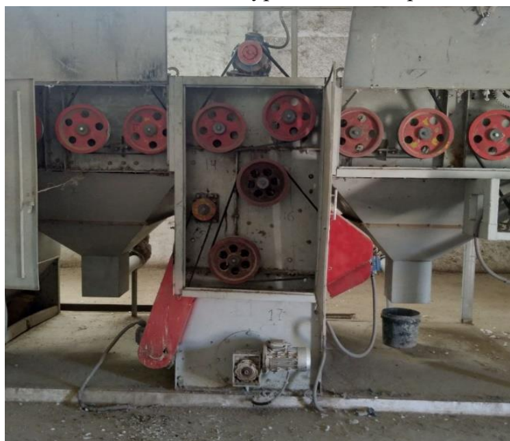
2-расм. Сериядаги тозалагичнинг ён томондан кўриниши

2-расмда тозалагичнинг ён томондан кўриниши келтирилган.