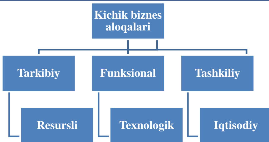
2-rasm. Kichik biznes aloqalari.

Ma'lumki, kichik biznes bozor iqtisodiyotidagi o'zgarishlarga tez moslashadi, bozor talablari asosida tez ixtisoslashadi, iqtisodiyotdagi yangi innovatsiyalarni tez o'zlashtiradi. 1990 yillardan boshlab, zamonaviy innovasion tizimlar shakllana boshladi, bu tizimlarga texnoparklarni, biznes inkubatorlarni, injinering markazlarni, ilmiy-tadqiqot tashkilotlarini, nanotexnologik markazlarni kiritish mumkin. Kichik biznes korxonalarini bozor iqtisodiyoti talablariga mos rivojlanishi uchun sohaga ko'proq innovatsiyalarni keng joriy etish maqsadga muvofiqdir[5].