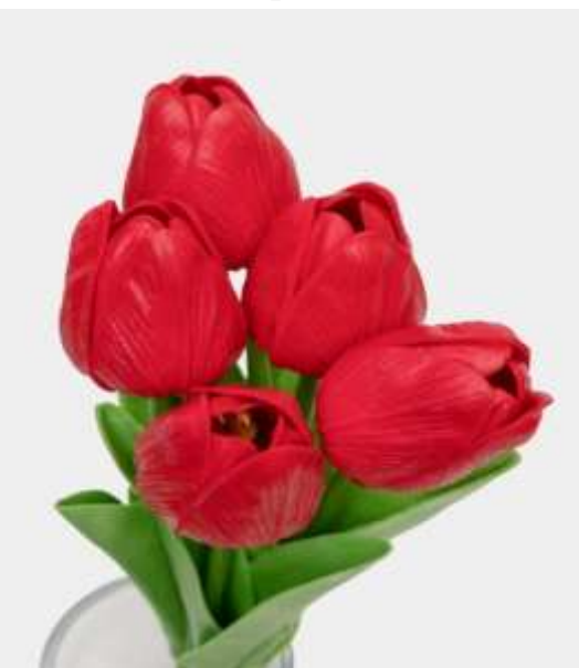
2. Gul nomi: Lola