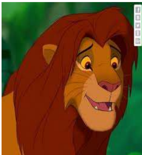
2. Hayvon nomi: Arslon

Bu singari o'zimlik va hayvon nomlarining inson ismlariga qo'yilishiga oid misollar juda ko'p bo'lib ulardan ba'zilari: Rayxon, Nilufar, Nargiz, Gullola, Gunafsha, Navro'z, Ra'no, Gulira'no, Sunbula, Nastarin, Lochin, Qoplon.