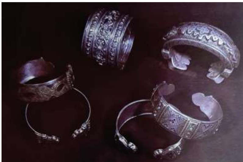
Рис.1. Пример незамкнутого типа браслета «билаг-узук»

- Замкнутые браслеты, более сложные в изготовлении, часто украшались вставками из драгоценных и полудрагоценных камней, рельефными орнаментами и филигранью (рис.2).