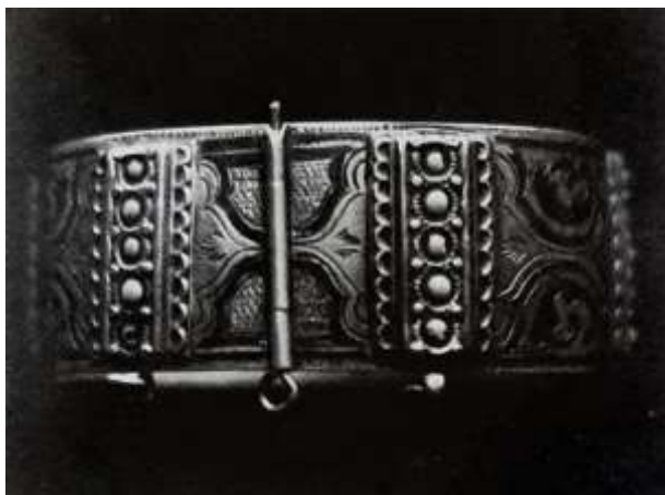
Рис.3. Браслет. Ташкент, вторая половина XIX в. Серебро, бирюза. Босма, чернь, гравировка, золочение.

Чеканка — это техника, с помощью которой на металлической поверхности создается рельефное изображение. Мастер с помощью специальных инструментов выстукивает рисунок, создавая объем. Чеканка позволяет создавать более сложные и выразительные орнаменты, чем гравировка. Часто ее используют в сочетании с другими техниками, такими как гравировка или филигрань (рис.4).