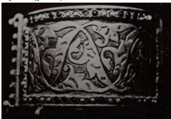
Рис.4. Браслет. Самарканд, вторая половина XIX в. Серебро, коралл, стекло. Босма, чеканка.

Чеканка — это техника, с помощью которой на металлической поверхности создается рельефное изображение. Мастер с помощью специальных инструментов выстукивает рисунок, создавая объем. Чеканка позволяет создавать более сложные и выразительные орнаменты, чем гравировка. Часто ее используют в сочетании с другими техниками, такими как гравировка или филигрань (рис.4).