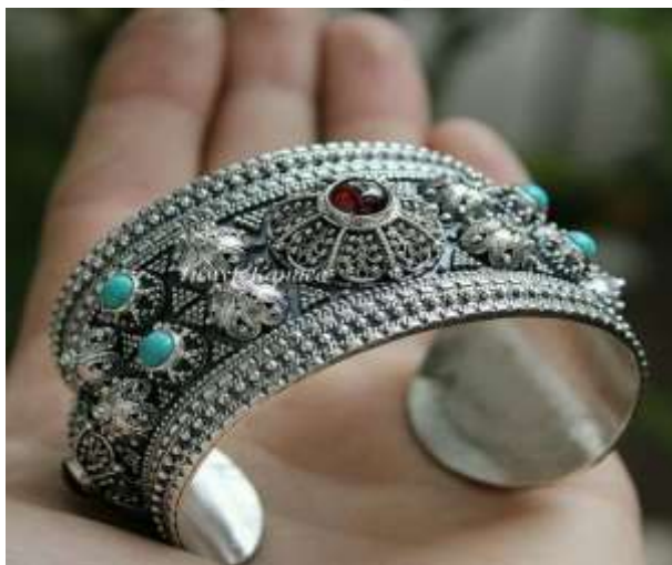
Рис.8. Примеры комбинирования техник Серебряный браслет "Этно", Материалы: серебро 925 пробы, Натуральный гранат, натуральная бирюза.

рисунка, а затем украсить его филигранью и зернью. Или же нанести на поверхность браслета рельефный орнамент с помощью чеканки и покрыть его цветной эмалью. Это позволяет создавать уникальные и оригинальные украшения, которые будут радовать глаз на протяжении многих веков (рис.8).