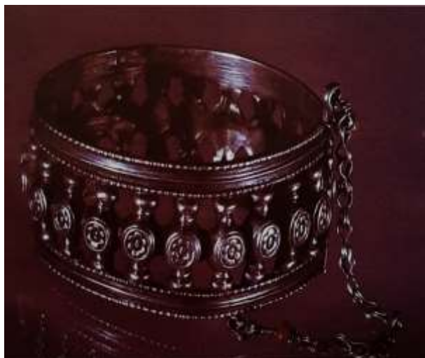
Рис.2. Пример замкнутого типа браслета. Самарканд, вторая половина XIX в.

- Замкнутые браслеты, более сложные в изготовлении, часто украшались вставками из драгоценных и полудрагоценных камней, рельефными орнаментами и филигранью (рис.2).